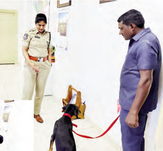
లైకా ఆరోగ్య పరిస్థితిని విచారించుతున్న జిల్లా ఎస్పీ