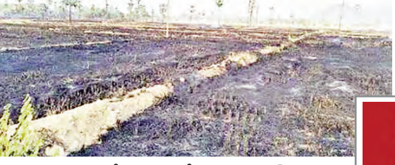
పంట అవశేషాలు కాల్వితే వ్యవస్థం (ఫైల్)

మహబూబ్ నగర్, మే 27 ప్రభాతవార్త : పంట కోత అనంతరం పొలాల్లో మిగిలిన పంట/తర పంట అవశేషాలను కాల్వితేయడం వలన పర్యావరణ కాలుష్యం పెరగడంతో పాటు నీల సారవంతం తగ్గిపోతుందని జిల్లా వ్యవసాయ అధికారి బి. వెంకటేశ్ ఒక ప్రకటనలో తెలిపారు. గాలి కాలుష్యం కారణంగా ప్రజల ఆరోగ్యంపై ప్రతికూల ప్రభావం పడుతుందని పంట అవశేషాలను కాల్వితేయడం వల్ల నేలలోని ఉపయోగకరమైన సూక్ష్మజీవులు నశించి భూమి సేంద్రీయం కార్బన్ సేంద్రీయం తగ్గిపోతుంది తెలిపారు. దీనివల్ల భవిష్యత్తులో పంట దిగుబడులపై ప్రభావం వడే అవకాశం ఉందని, అందువల్ల రైతులు పంట