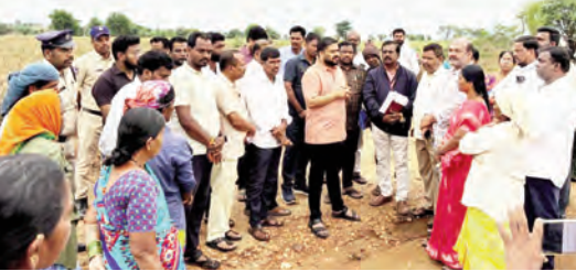
ఉపాధి కూలీలతో మాట్లాడుతున్న జిల్లా కలెక్టర్ హేమంత్ కేశవ్ పాటిల్

అప్పంపేట, మే, 27 ప్రభాతవార్త: నాణ్యతతో కూడిన పనులను పారదర్శకంగా పూర్తి చేయాలని జిల్లా కలెక్టర్ హేమంత్ కేశవ్ పాటిల్ అధికారులకు సూచించారు. బుధవారం అప్పంపేట నియోజకవర్గం పరిధిలోని బల్లూర్ మండలం లోని కొండనాగుల గ్రామంలో మహాత్మా గాంధీ జాతీయ గ్రామీణ ఉపాధి హామీ పథకం కింద చేపడుతున్న రోడ్డు పనులను పనులను హేమంత్ కేశవ్ పాటిల్ ఆసిస్టెంట్ సూపర్వైజర్లు పరిశీలించారు. గ్రామీణ ప్రాంతాల్లో మౌలిక వసతుల అభివృద్ధిలో పాటు గ్రామీణ పేదలకు ఉపాధి అవకాశాలు కల్పించే దిశగా ప్రభుత్వం అమలు చేస్తున్న ఉపాధి పనుల పురోగతిని ఆయన నేరుగా పరిశీలించి అధికారులకు పలు సూచనలు చేశారు. కొండనాగుల గ్రామం లో పనులు జరుగుతున్న ప్రాంతానికి చేరుకున్న కలెక్టర్ అక్కడ పనిచేస్తున్న కూలీలతో ఆస్పాద్యంగా మాట్లాడారు. రోజువారీ హాజరు నమోదు, కూలీ వైద్యంపై సమయానికి అందుతున్నారా లేదా అనే అంశాలపై ఆరా తీశారు. కూలీలకు తాగునీరు, సీడ్, ప్రభుత్వ వీటికేవలనే ప్రాథమిక సదుపాయాలు అందుబాటులో ఉండేలా చర్యలు తీసుకోవాలని సంబంధిత అధికారులను ఆదేశించారు. మహిళా కూలీలతో ప్రత్యేకంగా మాట్లాడి పనిస్థలాల్లో ఎదురవుతున్న ఇబ్బందులను తెలుసుకున్నారు. ఈ సందర్భంగా కలెక్టర్ మాట్లాడుతూ ఉపాధి హామీ పథకం