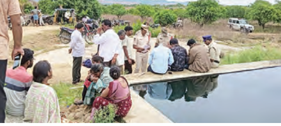
మామిడి తోటలో సంచిత వర్ష వనసామా నిర్వహిస్తున్న పోలీసులు