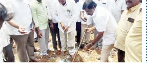
ఉప్పునుంతల హైస్కూల్లో భోజనశాలకు భూమి పూజ చేస్తున్న ఎమ్మెల్యే

టిపిసీసీ ఉపాధ్యక్షుడు డా. చిక్కూడు వంశీకృష్ణ